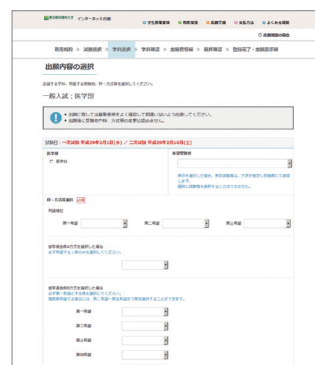
▲インターネット出願サイト