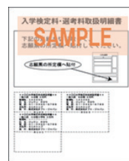
入学検定料・選考料 取扱明細書(収納証明書)