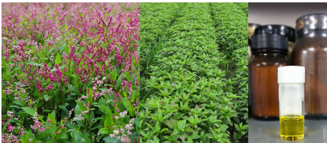
（左・中央）あおり藍の葉、（右）抽出された「あおり藍葉エキス」

本件に関する論文が、令和4年（2022年）2月10日（木）23：00（日本時間）に、実験医学・実験薬学分野の国際的な学術誌“Experimental and Therapeutic Medicine”に掲載されました。